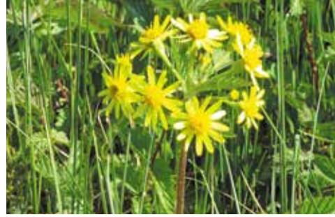
Le séneçon à feuilles en spatules a fleuri dans la réserve de la Vraconnaz.

A Yverdon, Pro Natura Vaud n'a pas réussi à s'opposer à un énorme projet de halle. Le Service des forêts a accordé une dérogation à la distance de 10 mètres de la lisière forestière, une distance pourtant minimale comparée à celle qui est imposée dans les cantons voisins. Dans un autre cas, la Municipalité a d'abord refusé le permis de construire pour un projet dont les aména-