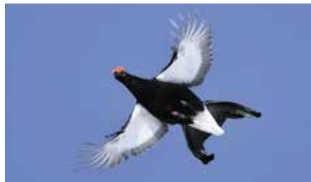
Tétraz lyre

Faune, avifaune et flore de la réserve d'Ai-Famelon , avec le responsable de réserve J. Erard, jacqueserard@bluewin.ch . Inscription obligatoire. Train de Lausanne 7h21, changer à Aigle, arr. Leysin-Feydey 8h23. Sentier de montagne, pique-nique. Retour 16h58.