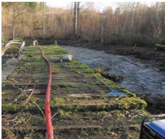
Revitalisation de l'étang de la Morenche, financée par une recherche de fonds.

La réalisation de projets de conservation de la nature constitue l'épine dorsale de notre action. Une part essentielle de mon travail réside dans la recherche active de fonds pour les soutenir. Présenter de manière convaincante les projets de la section aux bailleurs de fonds, en mettant en avant leur impact positif sur la biodiversité et l'environnement, est essentiel afin de mobiliser les ressources financières nécessaires à leur réalisation. Je m'assure que les fonds alloués sont utilisés de manière efficace et conformément aux objectifs fixés. La transparence dans la gestion financière renforce la confiance des donateurs et contribue à établir des partenariats durables.