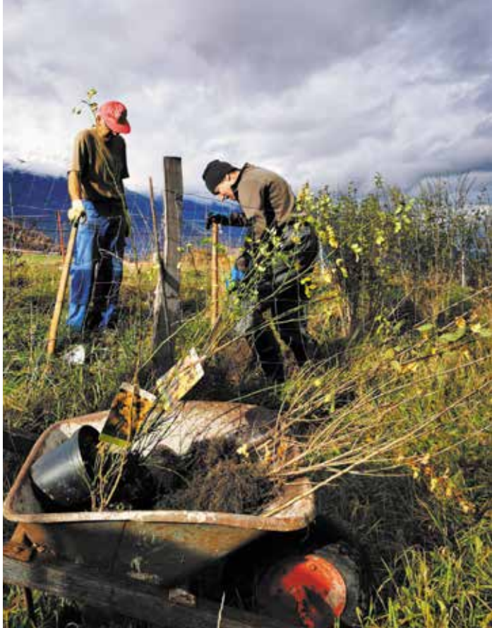
Des bénévoles au travail lors de la plantation d'une haie à Bex.