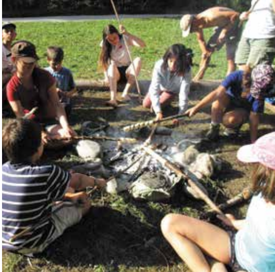
Cuire son pain trappeur sur les braises.

Dès 12 ans, les plus grands ont la possibilité de participer aux activités nationales. A l'automne, nous avons ainsi accueilli une dizaine d'ados dans notre canton. Au col de Jaman, les jeunes ont découvert la migration des oiseaux, le travail des ornithologues, une bonne fondue et la magnifique vue sur le Léman depuis la Dent de Jaman. Ce fut un beau week-end de partage, presque bilingue.