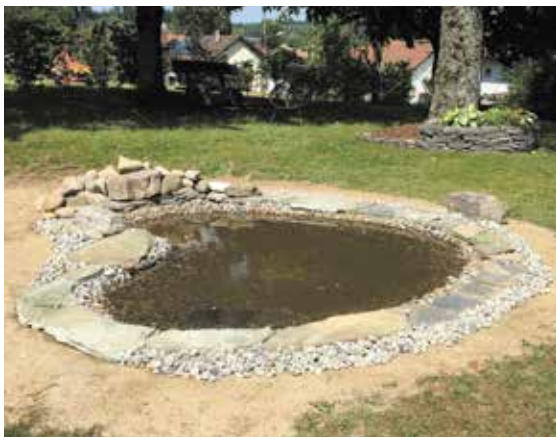
Nouvel étang créé sur les Hauts de Lausanne.