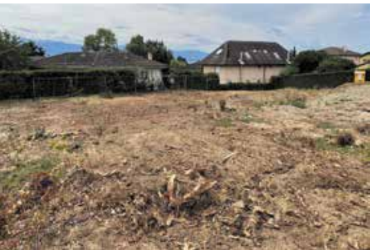
Coupe illégale de tous les arbres d'une parcelle à Saint-Prex