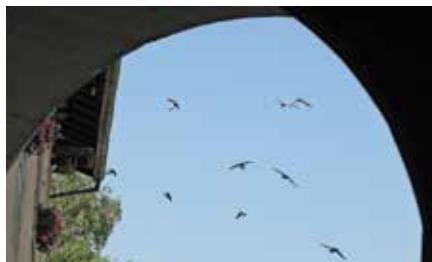
Martinets noirs