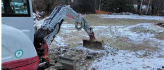
Le chantier de revitalisation de l'étang à Concise.

L'Association du Parc du Jorat a demandé de l'aide à notre groupe pour le projet de sauvetage de batraciens à l'étang de La Bressonne, le long de la Route des Paysans, au Chalet-à-Gobet. Le crapauduc existant ne suffit plus à contenir la migration des batraciens, en augmentation depuis quelques années. Des barrières provisoires ont été installées dans le prolongement de