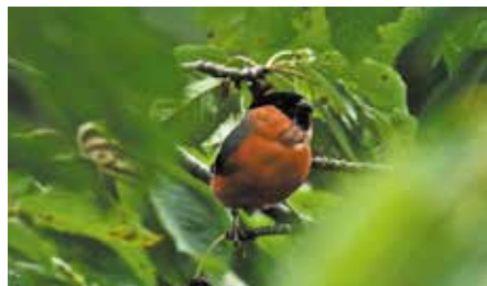
Bouvreuril pivoine

La colline du Montet , avec l'ornithologue François Estoppey. Max. 15 personnes, Inscription obligatoire sur https://fetedelanature.ch . Rdv gare de Bex. Train de Lausanne 7h11, arr. 7h48, train pour le Bévieux 8h02, arr. 8h12. Marche de 6-7 km et dénivellé de 200 m sur sentiers forestiers faciles. Découverte du flanc nord, frais et humide, de sa hêtraie, de ses blocs erratiques, puis du flanc sud, chaud et sec, de ses châtaigneraies ; pique-nique au sommet, descente vers Bex. Train 15h07 ou 16h11.