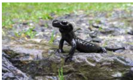
Salamandre noire