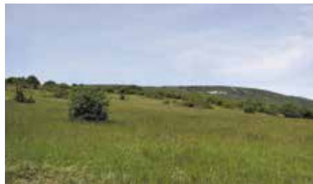
La Chassagne d'Onnens

La végétation du sud en terre vaudoise , avec les botanistes Patrick Charlier et Michel Vauthey. Max. 14 personnes, inscription obligatoire sur https://fetedelanature.ch . Rdv au parking au pied de la Chassagne, à 700 m de l'arrêt Onnens VD Croisée. Train de Lausanne 8h15, changer à Yverdon, bus 630 8h42, arr. 9h05. Découverte botanique de la Chassagne d'Onnens. Marche facile, pique-nique. Retour vers 16h, bus 630 aux 50 ou bus 635 aux 15.