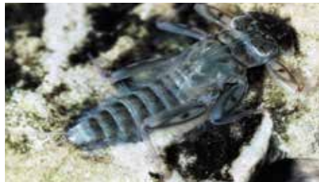
Larve d'éphémère