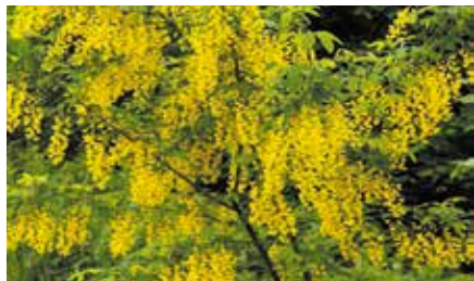
Cytis aubour