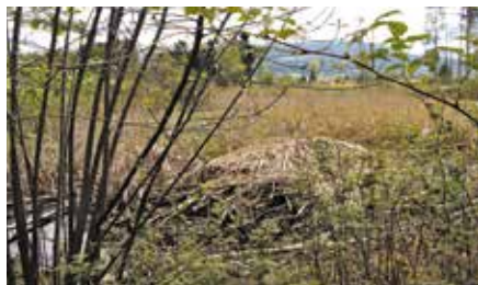
Hutte de castor