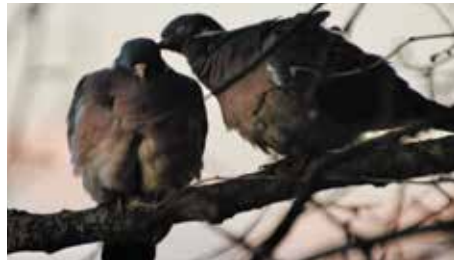
Pigeons ramiers

Le chant des oiseaux de la forêt , avec l'ornithologue François Burnier, 079 683 37 43. Inscription obligatoire. Enfants accompagnés bienvenus. Rdv à la gare de Pampigny-Sévery. Train de Morges 7h11, changer à Apples, arr. 7h34. Retour 12h22.