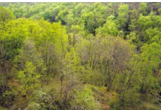
La forêt du Bois de Chêne d'Echilly.

De nombreux entretiens de sites se font par le biais d'entreprises ou par des agriculteurs. Nous pouvons également compter sur une équipe de bénévoles extrêmement motivée pour effectuer des entretiens plus légers à la main, afin d'éviter les dommages