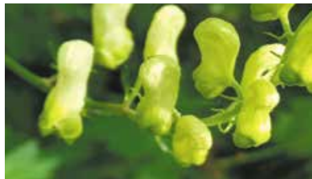
Aconit tue-loup

Le long de la Broye en partie renaturée , entre deux cantons, avec la botaniste F. Hoffer-Massard, franchoisehoffer@yahoo.fr . Rdv à la gare d'Henniez. Train de Lausanne 8h13, arr. 9h03. Parking à Granges-Marnand, train 8h53, arr. 8h56. Pique-nique. Retour de Granges-Marnand l'après-midi, trains aux 53 et 23.